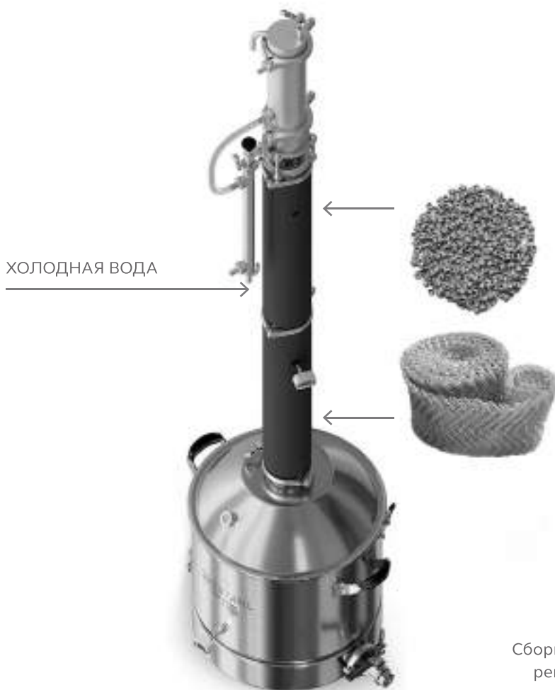
Рисунок 6. Сборка в режиме ректификации