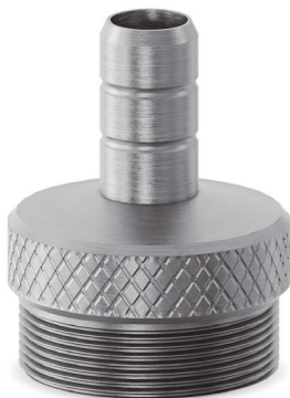
Рисунок 2. Переходник на кран

Из крана с внутренней резьбой выкрутите аэратор (ситечко), и установите дивертор с переходником на кран, 8мм.