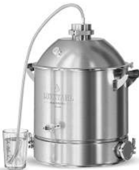
Рисунок 3. Сборка в режиме брожения браги

Приготовьте брагу согласно рецепту. Самая простая брага, из которой получаются отличный по своему аромату самогон и хороший 96% спирт для настоек и наливок – брага из сахара.