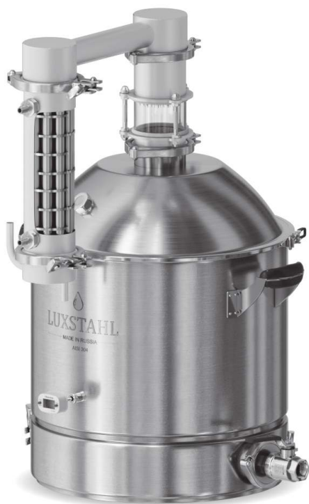
Рисунок 5. Сборка в режиме простой перегонки

От крана холодной воды – к нижнему штуцеру теплообменника, отвод – из верхнего. Для проверки герметичности включаем воду, чтобы система полностью наполнилась (с обратного шланга пойдёт вода). Далее до нагрева выключаем воду для экономии.